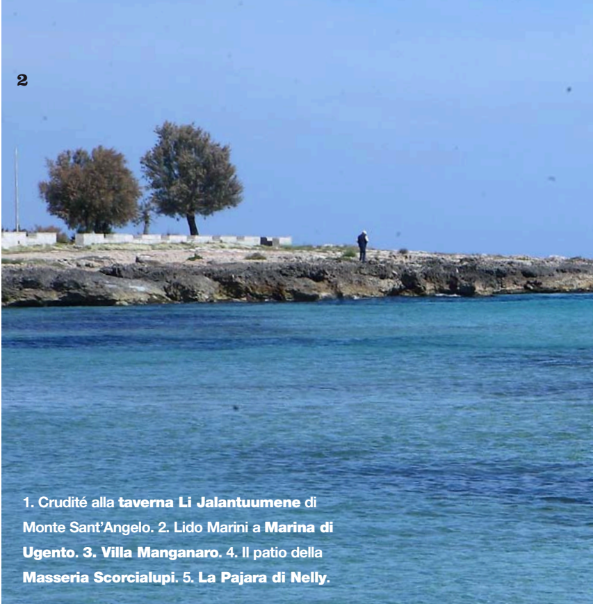
1. Crudité alla taverna Li Jalantuumene di Monte Sant'Angelo. 2. Lido Marini a Marina di Ugento. 3. Villa Manganaro. 4. Il patio della Masseria Scorcialupi. 5. La Pajara di Nelly.